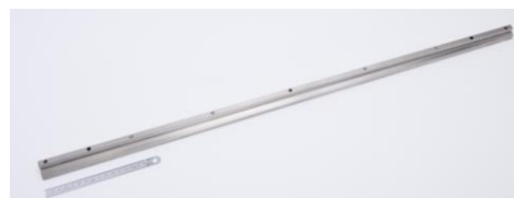
長尺ワークの加工ならお任せください！

城陽富士工業は2月14日～15日 京都パルスプラザで開催される「京都ビジネス交流フェア2019」に出典いたします！