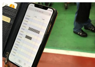
スマホで生産管理画面を！

当社ではより一層のQCD向上、また前述の働き方改革に対応する生産性向上を目的として、生産管理システムを刷新すると同時に、クラウド化いたしました。