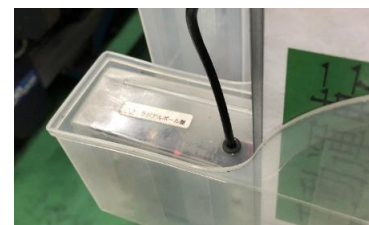
設備ごとに読み取り装置

これにより、従来は手入力で行っていた作業を、設備ごとに用意してある読み取り装置にタグを触れるだけで、簡単に入力作業を行うことができる様になりました。