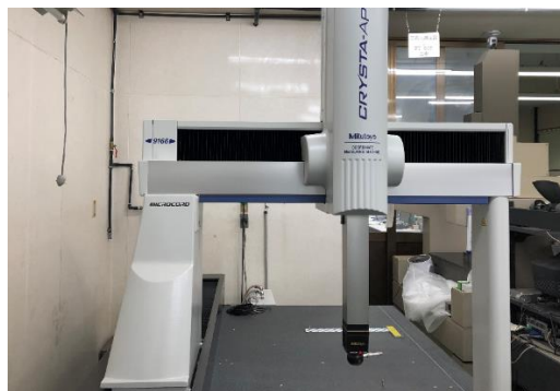
当社のCNC3次元測定機